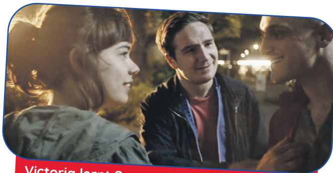
Victoria lernt Sonne (Mitte) und Boxer (r.) in Berlin kennen.

Club lernt die junge Victoria (Laila Costa) aus Madrid vier Berliner Jungs kennen – Sonne (Frederick Lau, einigen vielleicht aus „Die Welle“ bekannt), Boxer (Franz Rogowski), Blinker (Burak Yigit) und Fuss (Max Mauff). Der Funke zwischen ihr und Sonne springt sofort über, aber Zeit füreinander haben die beiden nicht. Sonne und seine