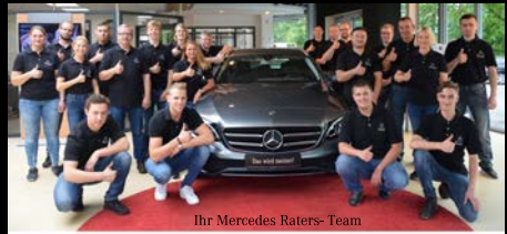
Ihr Mercedes Raters-Team