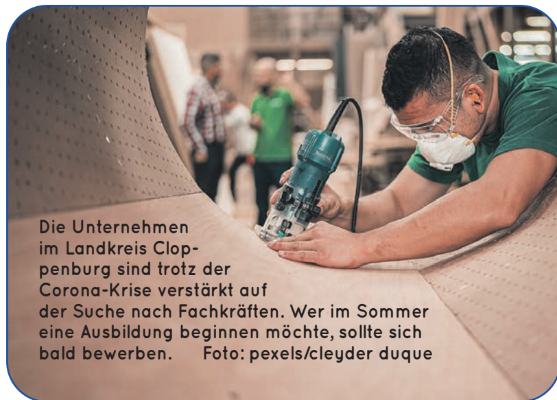
Die Unternehmen im Landkreis Cloppenburg sind trotz der Corona-Krise verstärkt auf der Suche nach Fachkräften. Wer im Sommer eine Ausbildung beginnen möchte, sollte sich bald bewerben.

Geschäftsführung der Agentur für Arbeit Vechta, hofft, dass viele Jugendliche und Eltern das Angebot annehmen und sich melden. „Schließlich hat die betriebliche Berufsausbildung gerade in herausfordernden Zeiten einen besonders hohen Wert. Sie sichert den Unternehmen im Oldenburger Münsterland den Fachkräftenachwuchs und bietet den jungen Menschen eine gute