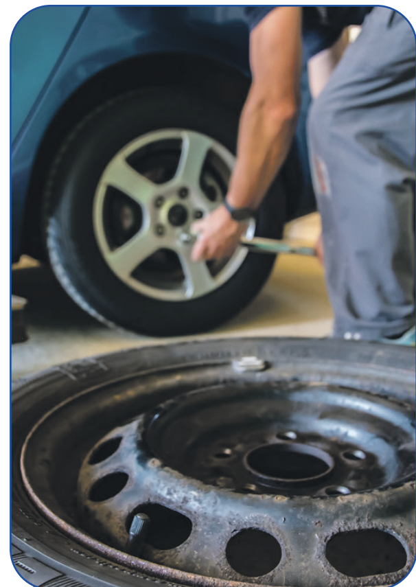
Unter Einhaltung der Hygiene- und Abstandsregeln ist ein Werkstattbesuch weiterhin möglich.

Eine verhältnismäßig größere Einschränkung gibt es bei den Kfz-Zulassungsstellen. Die meisten Behörden arbeiten gegenwärtig nur eingeschränkt oder sogar im Notbetrieb und manche haben gar nicht geöffnet. Falls die Zulassungsstelle Ihrer Wahl geöffnet ist, sollten Sie auf jeden Fall mit längeren Wartezeiten rechnen und sich vorab bei der zuständigen Behörde vor Ort informieren. Alternativ gibt es die Möglichkeit, die Zulassung Online vorzunehmen.