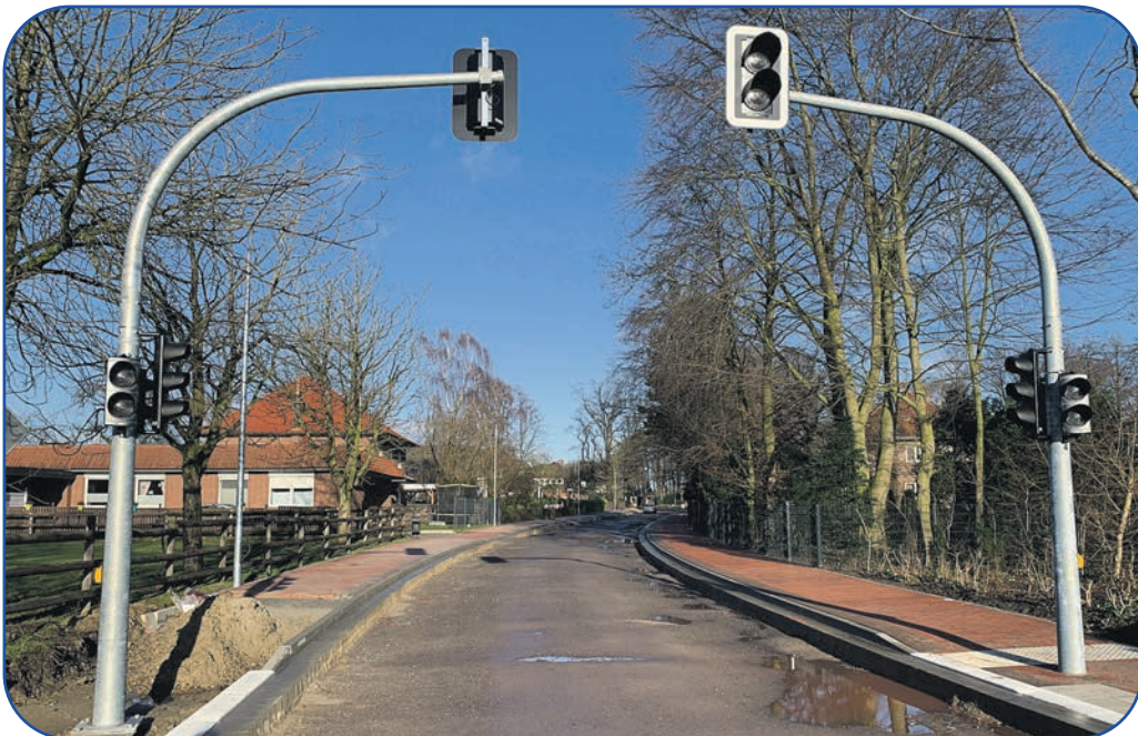
Die „Dunkelampel“ an der Kreuzung Kirchstraße/Hauptstraße ist bereits startklar.

Der Fischereiverein Essen führt zurzeit einen Online-Kurs zur Vorbereitung auf die Fischereiprüfung durch. Der Einstieg ist noch möglich. Für alle die Angeln wollen, ist nach dem Nds. Fischereigesetz ab 14 Jahre eine Prüfung erforderlich. Ausgebildet wird in allgemeine und spezielle Fischkunde, Gerätekunde, Gesetzeskunde und Natur und Tierschutz. Wer noch am Lehrgang teilnehmen möchte, kann sich melden unter fischereiverein-essen@ewetel.net oder 05434/1591 (Bernard Landwehr). Die Kosten für Lehrgang und Prüfung betragen 90 Euro.